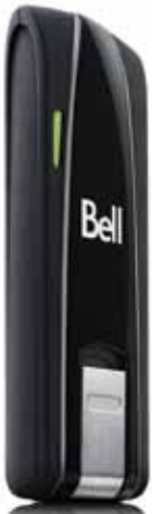
U547 de Novatel Wireless